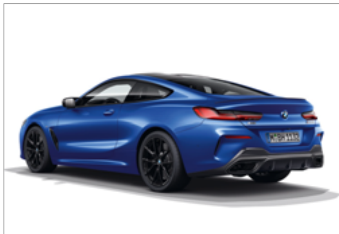
BMW 840d xDrive Coupé

Obrázky jsou ilustrativní. Změny v obsahu, jakož i tiskové chyby a omyly jsou vyhrazeny.