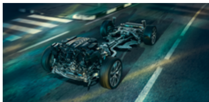
2VW – M adaptivní podvozek Professional

Obrázky jsou ilustrativní. Změny v obsahu, jakož i tiskové chyby a omyly jsou vyhrazeny.