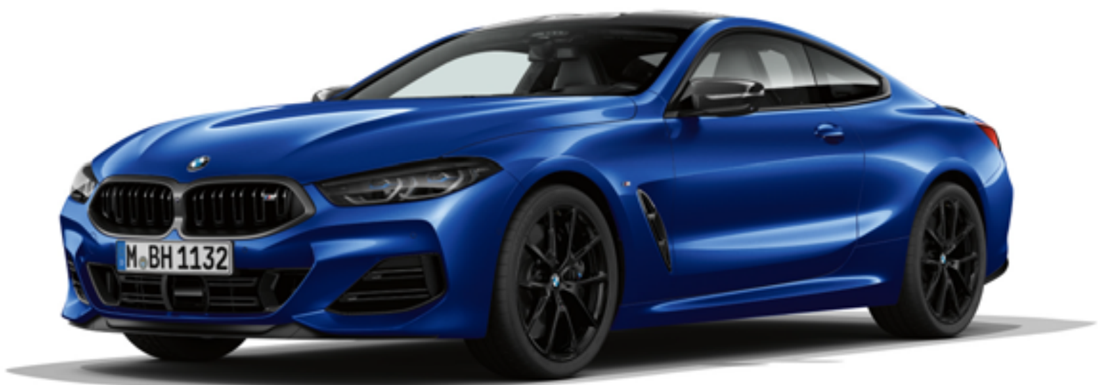
BMW 840d xDrive Coupé