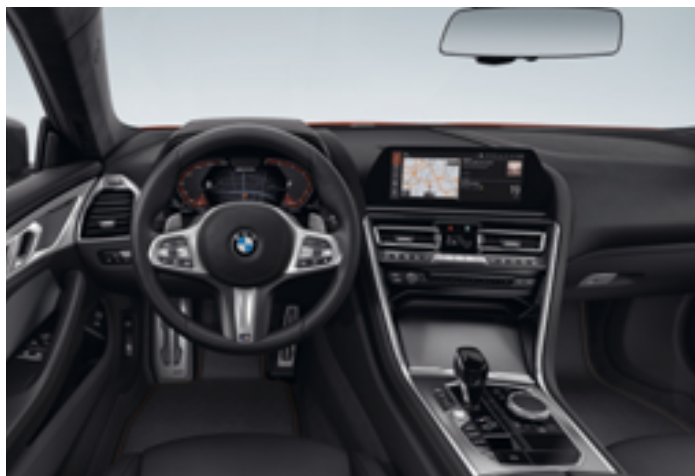
Kůže Merino s rozšířeným obsahem