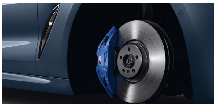
2NH – M sportovní brzdy